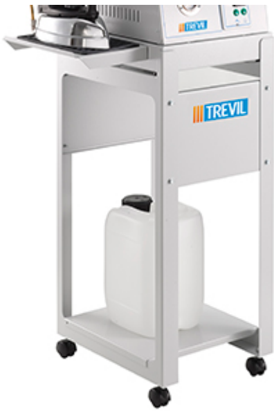
Tanica per il rabbocco inclusa