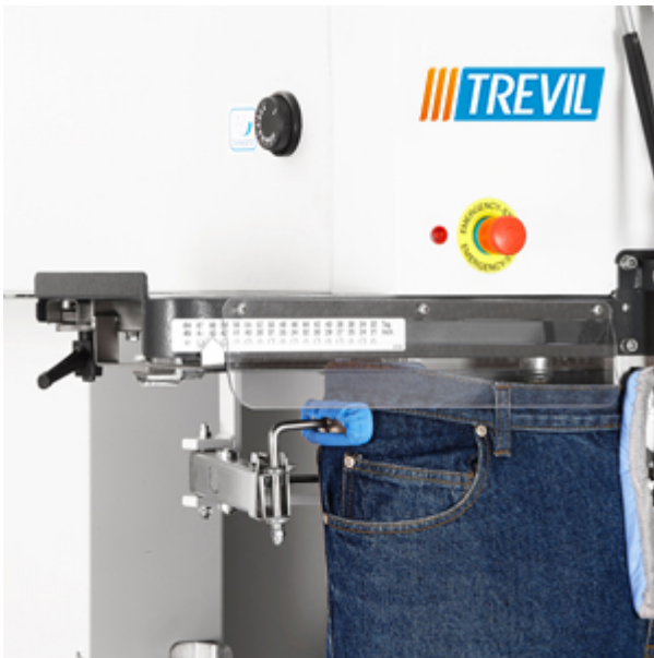
Selettore di taglia manuale per la cintura